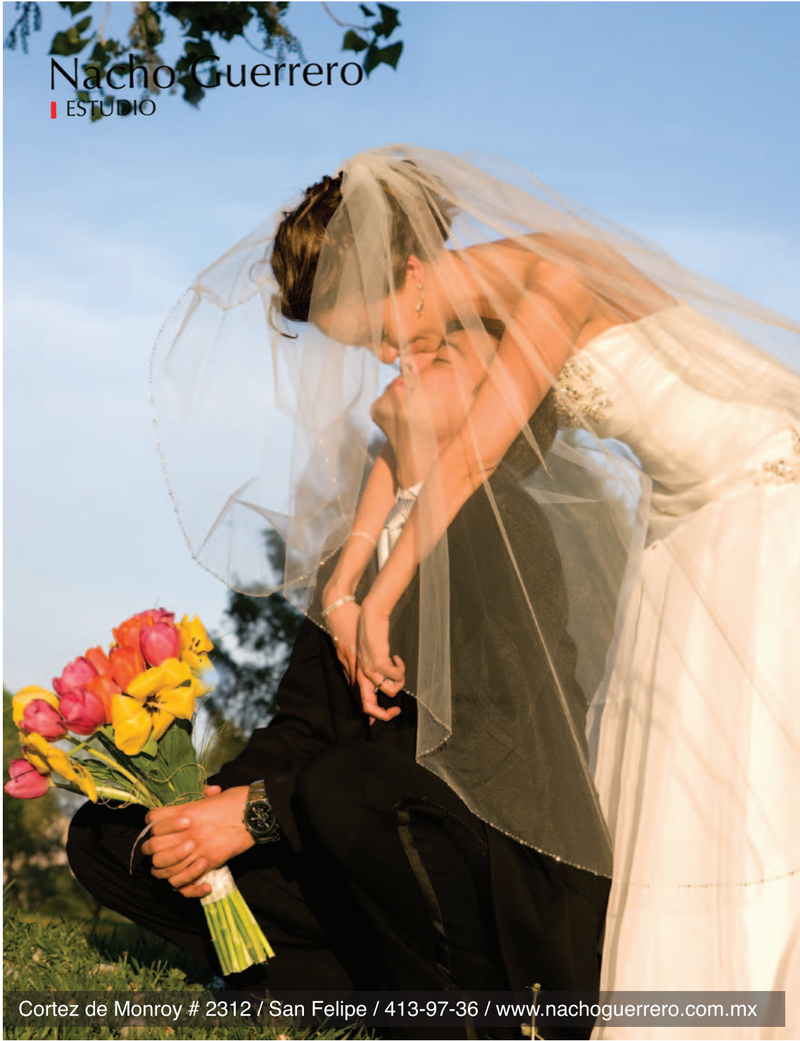
Cortez de Monroy # 2312 / San Felipe / 413-97-36 / www.nachoguerrero.com.mx